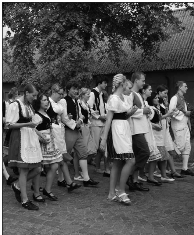
Letošní Staročeské máje se konaly 8. května.

Informace na tel.: 606 911 991 nebo 325 513 140, Miroslav Vacek